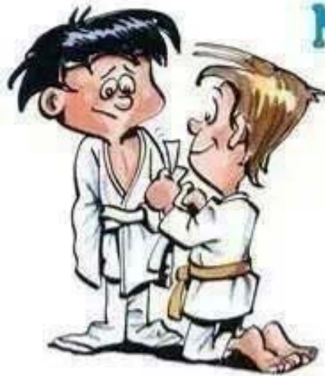
AYUDAR AL MAS NUEVO