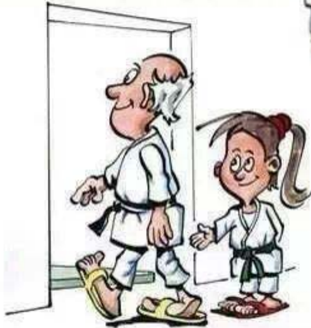
RESPETO A LOS MAYORES